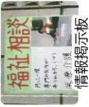
福祉相談 情報掲示板