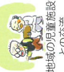
地域の原簿施設との交流