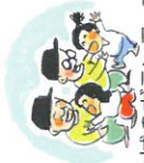
地域のボランティア活動参加