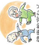
健康教室などサークル活動参加