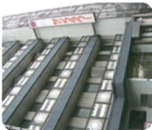
シェアライフハウス サンフラワー