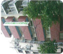
レインポーハウス