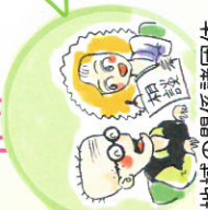
地域の関係諸団体 (NPO・支援団体・社会福祉法人など)