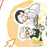
市・区の保健福祉センター