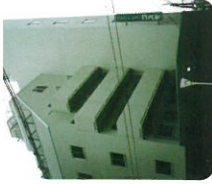
メゾンドヴェュー コスモ