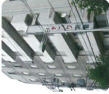
シェアライフハウス ナニワ別館