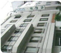
ウェルフェア マンション おはな